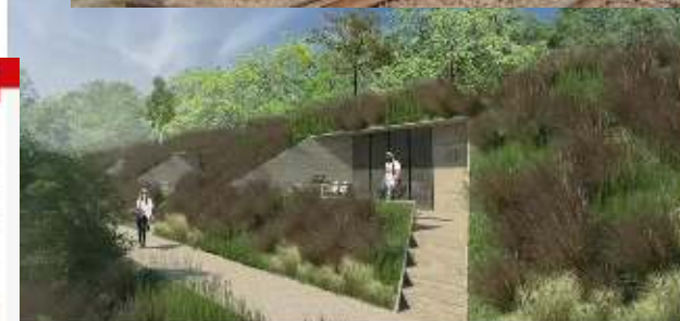
▲ Impresie van hoe de dijksuites straks zijn ingepakt in de dijk. © WTB Architecten